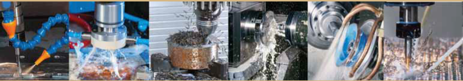
TABELA DE PREÇOS (R$) – 2016